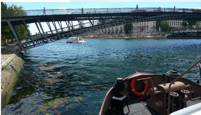
Vue depuis le bateau (ci-dessus) et l'installation sous le pont en salle des machines (à droite)

Grâce à sa polyvalence, le système peut aussi être adapté dans des cuves existantes, décliné en version terrestre ou containers, de 1 à plusieurs milliers de personnes et accepte les sous-charges et sur charges : la seule limite est votre imagination.