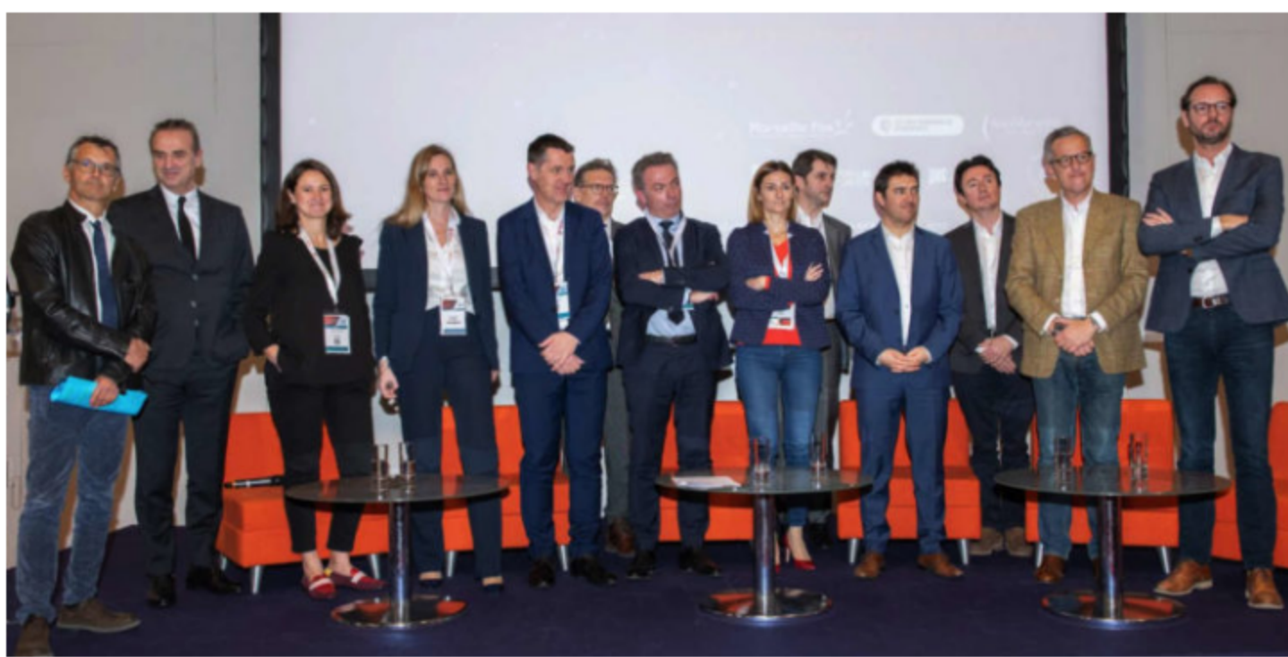
Les partenaires du Smartport Challenge 2e saison réunis au salon Euromaritime en février dernier.

par Richard Michel · 17 juin 2020 à 07h52